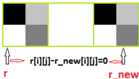
Рис.3. Класифікація рангових блоків

то два рангові блоки є однаковими і в IC нового рангового блоку необхідно записати номер по порядку (ПП) рангового блоку з яким виконалось порівняння та було отримано r[i][j] - r\_new[i][j] = 0 . Наприклад, r має номер ПП = 0 і значення IC = -1, r\_new має номер ПП=2, значення IC дорівнює номеру ПП блоку r , тобто IC = 0 (рис. 3).